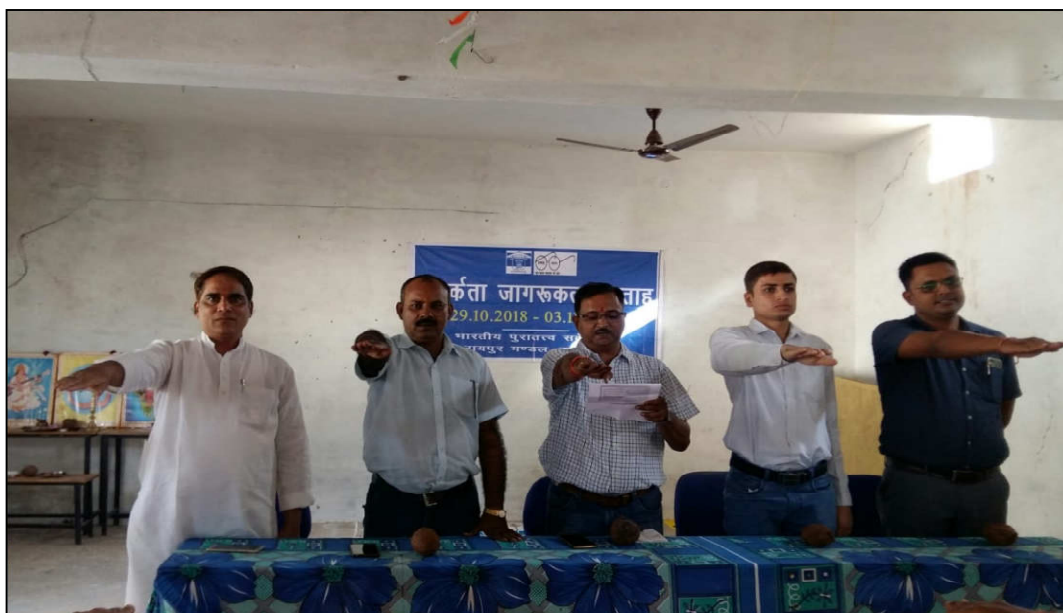
दिनांक 31-10-2018 को भारतीय पुरातत्त्व सर्वेक्षण, रायपुर मंडल, रायपुर के अधीन उप मंडल, बिलासपुर के केन्द्रीय संरक्षित स्मारक कंठीदेवल, रतनपुर, जिला-बिलासपुर के कर्मचारियों एवं स्थानीय सरस्वती शिशु विद्यालय, रतनपुर के संयुक्त तत्वावधान में शपथ ग्रहण/ Taking oath jointly with the employees of centrally protected monument Kanthi Dewal, Ratanpur, District Bilaspur of Bilaspur Sub Circle under the Archaeological Survey of India, Raipur Circle, Raipur and Saraswati Shishu Vidyalay, Ratanpur on 31-10-2018.