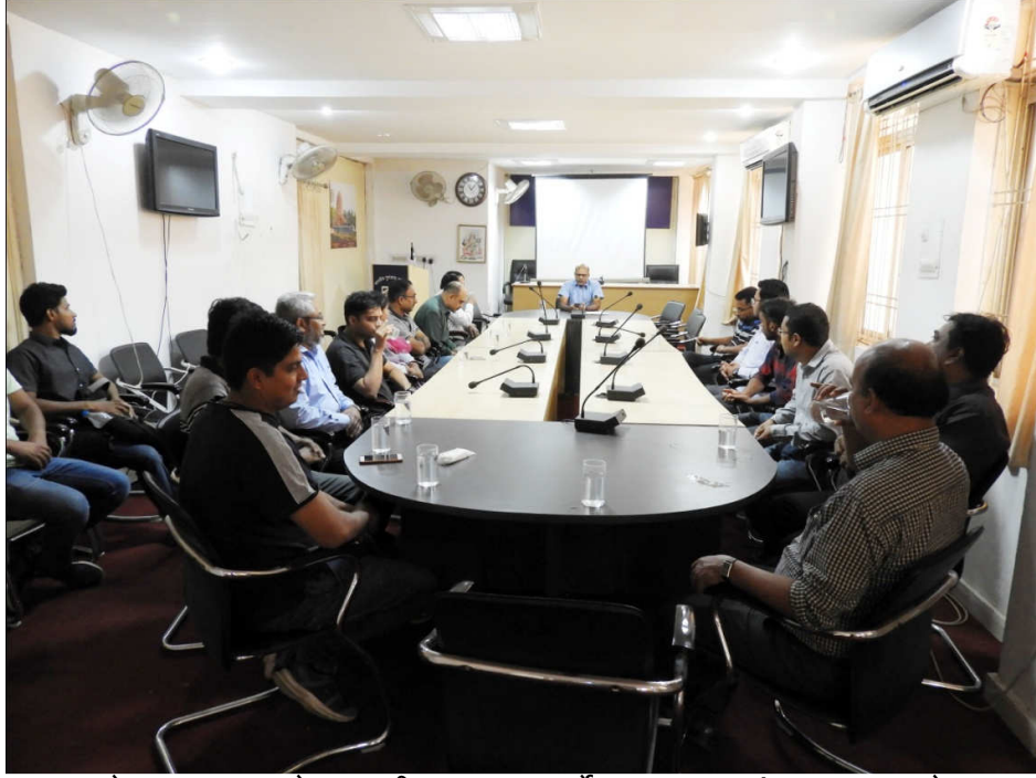
दिनांक 31-10-2018 को शपथ ग्रहण हेतु भारतीय पुरातत्त्व सर्वेक्षण, रायपुर मंडल, रायपुर के सभागार में कर्मचारियों के उपस्थिति / Presence of employees in the Conference Hall of Archaeological Survey of India, Raipur Circle, Raipur for taking Oath on 31-10-2018