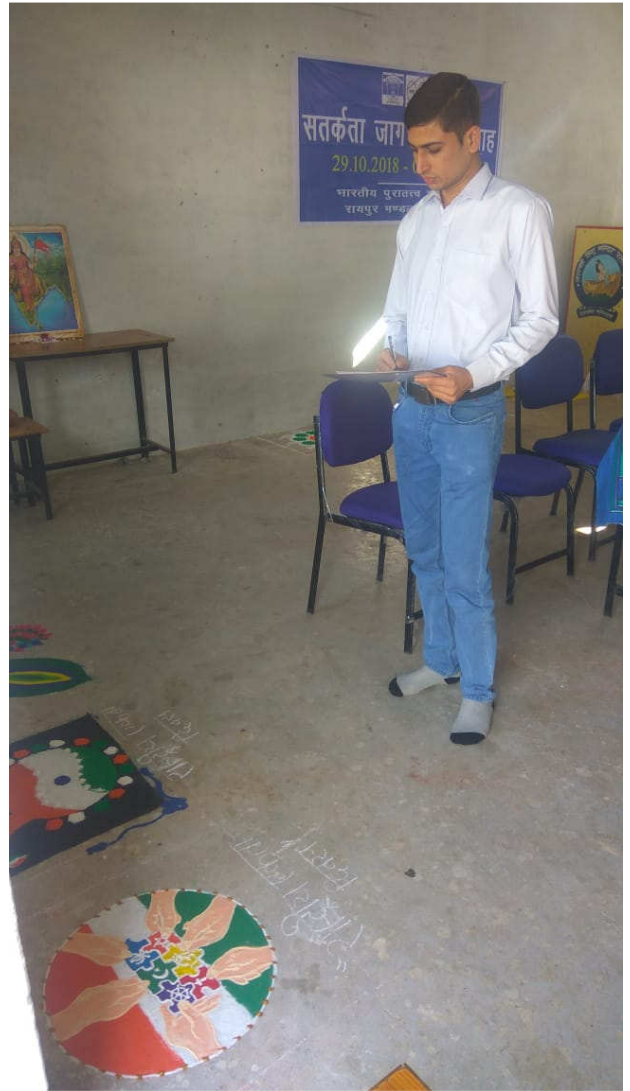
दिनांक 31-10-2018 को आयोजित रंगोली का चयन कमेटी के द्वारा परीक्षण Examination of Rangoli by the Selection Committee on 31-10-2018.