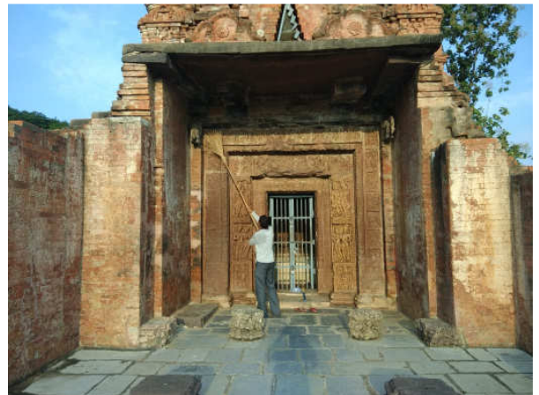
स्मारक के गर्भगृह की सफाई कार्य। (Cleaning work of Garbhagriha of the Monument.)