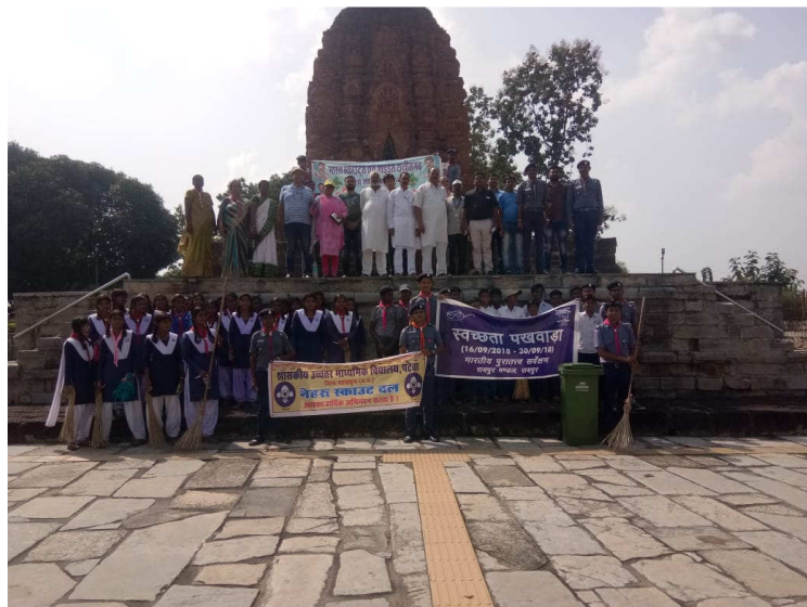
निबंध प्रतियोगिता में भारत स्काउट्स एवं गाइड्स के बच्चों भाग लेते हुए। Participation of students of Bharat Scouts & Guides in the Essay Competition.